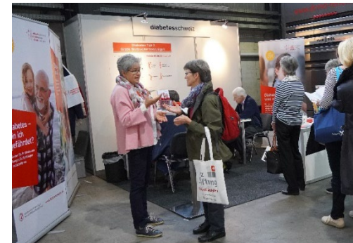
Messe Zukunft Alter 2019, Luzern