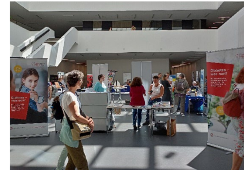
T1D-Tag 2022, Olten

Informieren Sie sich über die geplanten Anlässe im 2024 unter www.diabetesschweiz.ch .